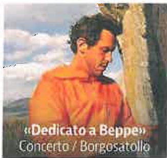
«Dedicato a Beppe» Concerto / Borgosatollo

«Tributo a Francesco Guccini» con Flaco Biondini e Vince Tempera, già componenti delle band del cantautore emiliano, alle 20.45 all'auditorium dell'oratorio «Tovini» di Angolo Terme, nell'ambito del festival della canzone umoristica d'autore «Dallo sciamano allo showman». Il concerto è promosso dal gruppo Musica e Parole in collaborazione con varie realtà locali. Il ricavato (ingresso ad offerta libera) andrà a favore della missione ad Asmara (Eritrea) di suor Giusta Sorlini.