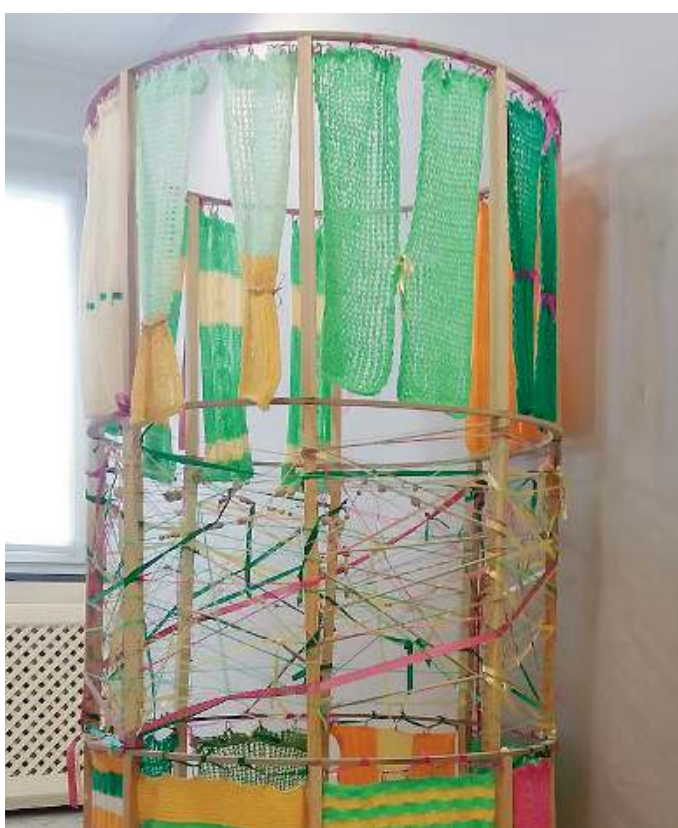
«Finestre sul mondo». Ecco l'opera realizzata da «nonni» e alunni

na - continua Agosti - hanno subito accolto con entusiasmo l'idea di partecipare alla mostra e riflettendo su cosa proporre, abbiamo pensato ad un lavoro svolto lo scorso anno in un progetto intergenerazionale».